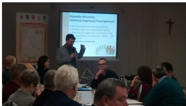
Forum Współpracy pomiędzy kluczowymi partnerami Łubianka, 11.12.2018r