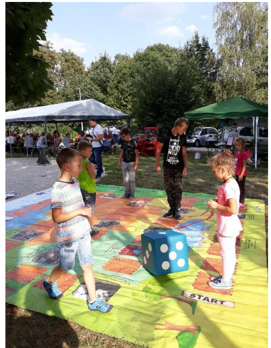
Biesiada leśna w Kielbasinie ( gm. Chelmża ) – 7.09.2018