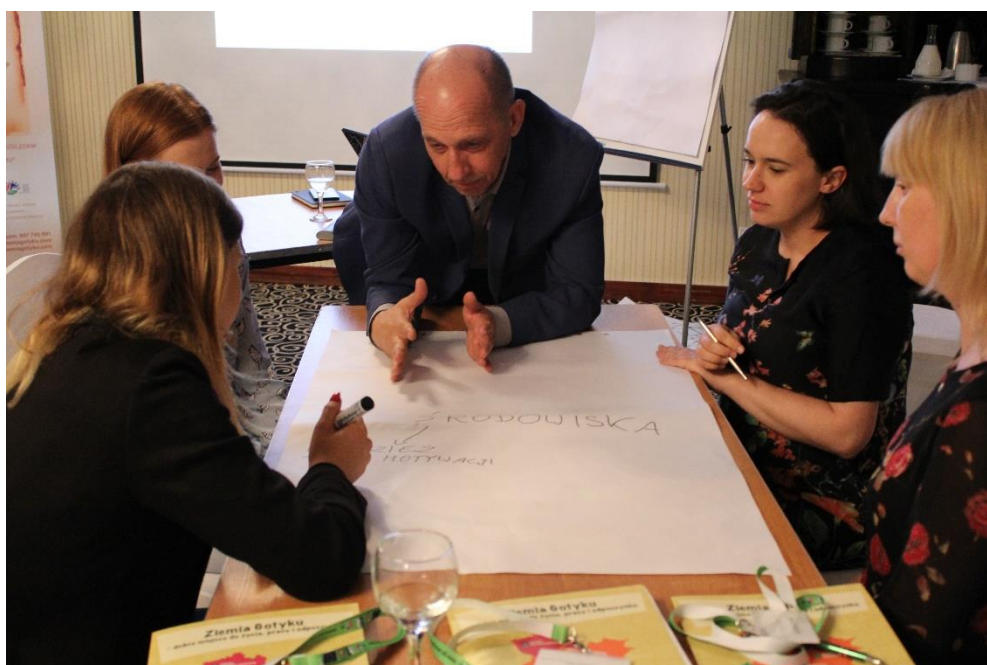
Warsztat tematyczny pt. Metody aktywizacji i animacji lokalnej Chelmża, 13.06.2018 r.