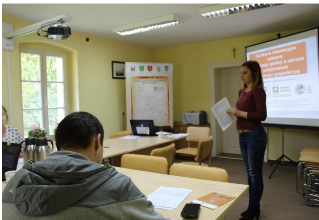
Szkolenie – Szkolenie związane z realizacją operacji w zakresie podejmowania działalności gospodarczej – 4.10.2018 r.