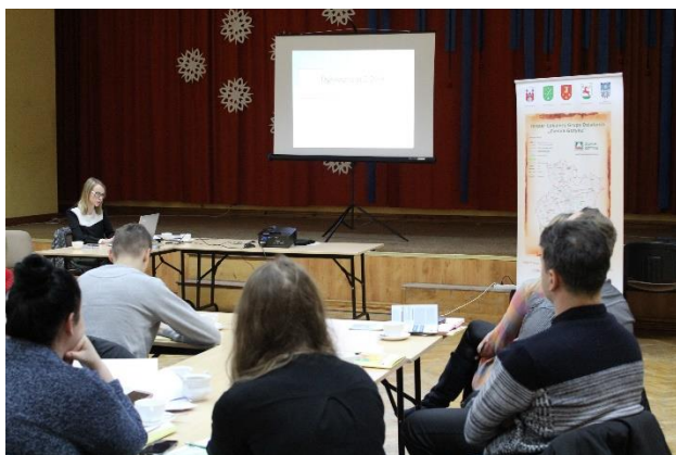
Szkolenia związane z naborem wniosków na podejmowanie i rozwijanie działalności gospodarczej w Chełmży – 09.02.2018 r.