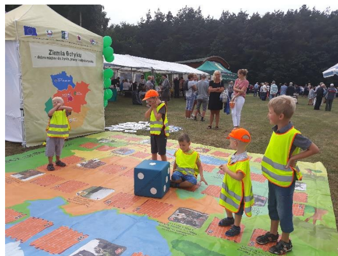
gm. Dożynki Gminne w Łubiance – 25.08.2018