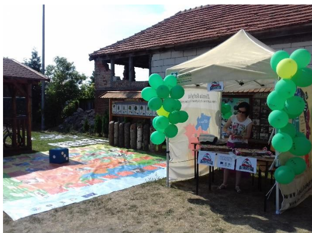
Rozpoczęcie lata w Brąchnowie – 30.05.2018