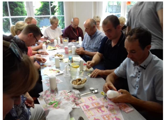
W dniu 12 czerwca 2018 r obszar Lokalnej Grupy Działania Ziemia Gotyku odwiedzili przedstawiciele LGD Sierpeckie Partnerstwo