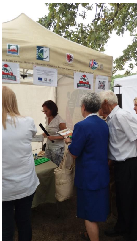
Dożynki Gminne w Kamionkach Łysomicach – 9.09.2018 r