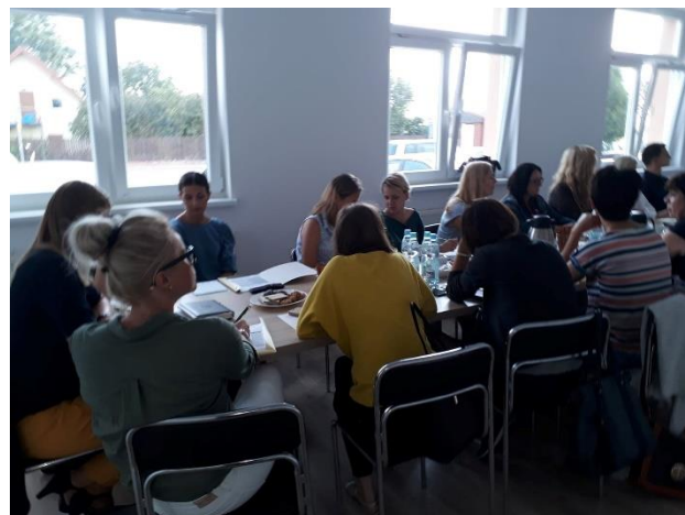
Spotkanie informacyjne dot. naborów wniosków w zakresie działań na rzecz osób zagrożonych ubóstwem lub wykluczeniem społecznym w Łubiance – 4.09.2018