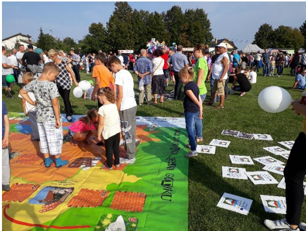
Dożynki Gminne w Papowie Biskupim – 2.09.2018