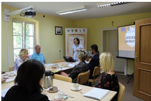
Spotkanie animacyjne, Brąchnówko, 18.09.2018r