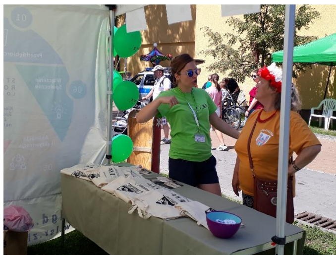
Dni Chełmży – 20.07.2018